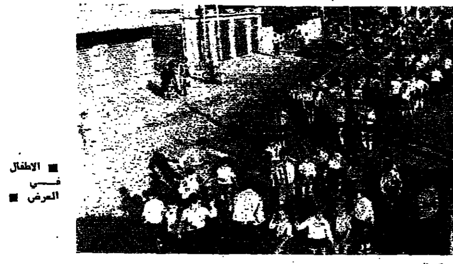
الاطفال في العرض